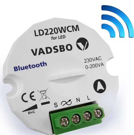
LD220WCM E 13 602 42

Blåtandsdimmer i dosformat. Speciellt anpassad för dimring av LED. Fungerar även utmärkt vid dimring av LED-driftsdon och glödljus.