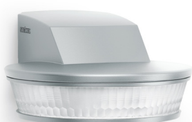
SensIQ S silver