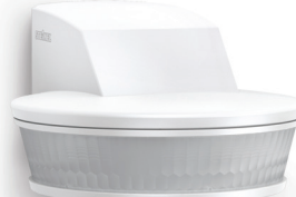
SensIQ S vit