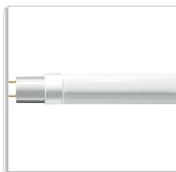
LEDtube 600mm, 1200mm &amp; 1500mm