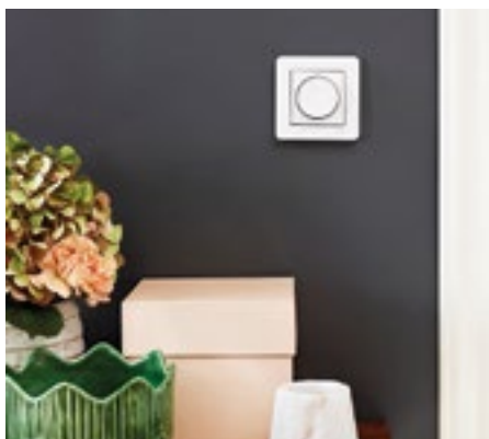
Exxact Dali dimmer Vit E-nr 13 602 37 Art.nr. WDE002466

DALI-dimmern finns i flera färger: vit, antracit och metallic