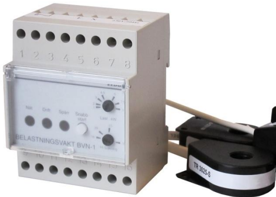
Bilden är beskuren

Belastningsvakt för övervakning av 3 faser.